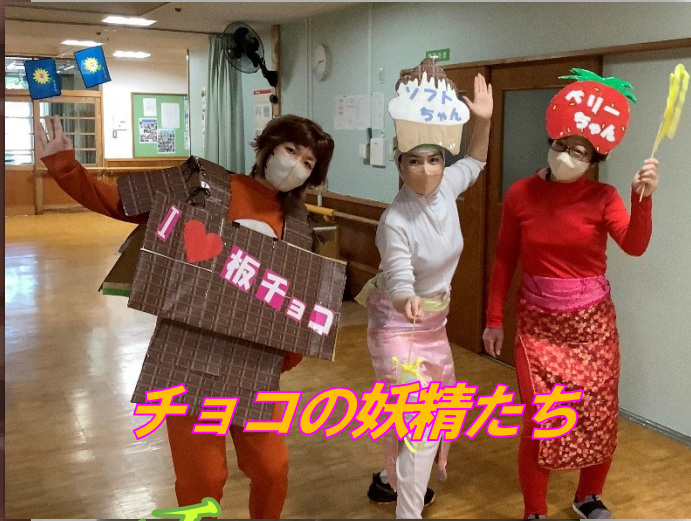
チョコの妖精たち